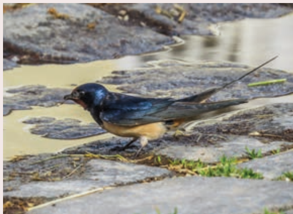
Natürliche Lehmquellen finden Schwalben immer seltener.

Zurückblickend auf unsere heißen Sommer der letzten Jahre ist es in vielen Gebieten notwendig, den Schwalben Baumaterial zum Nestbau anzubieten. Geeignetes Material wie feuchter Lehm ist immer seltener zu finden und meist sind die natürlichen Lehmflächen schon im Mai ausgetrocknet. Mit dem Angebot von Lehmputzen werden die Schwalben effektiv beim Nestbau unterstützt – zudem ist dies eine geeignete Möglichkeit, Schwalben auf Nisthilfen, die zur Neuan-siedelung oder als Ersatzmaßnahmen installiert wurden, aufmerksam zu machen. Besteht die Möglichkeit, die Lehmputze unmittelbar neben dem neuen Niststandort der Schwalben anzulegen, hat man gute Aussichten, die Schwalben in das Gebäude zu locken. Schwalben nehmen künstlich angelegte Lehmstellen gerne an, wenn folgende Faktoren berücksichtigt werden: