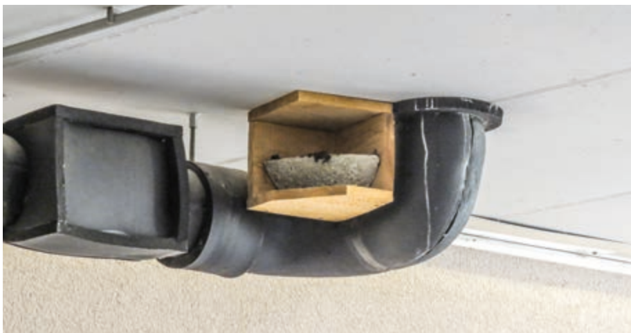
Der Schwalbenwinkel im Einfahrtbereich einer Tiefgarage.