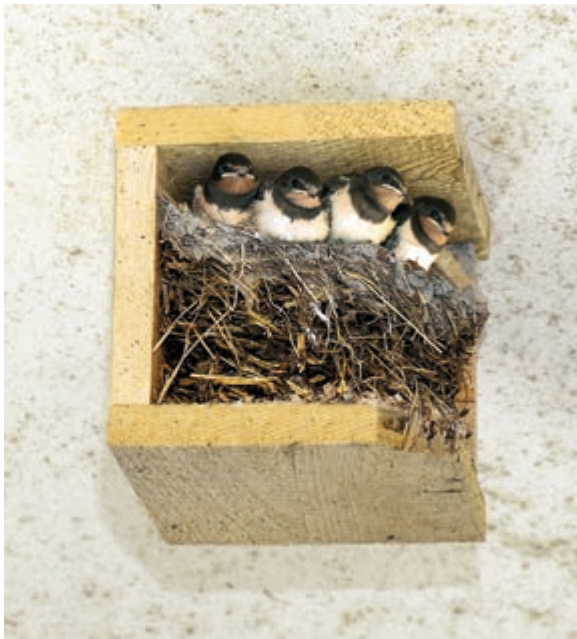
Schwalbenwinkel bieten den nötigen Schutz für ein Rauchschwalbennest.