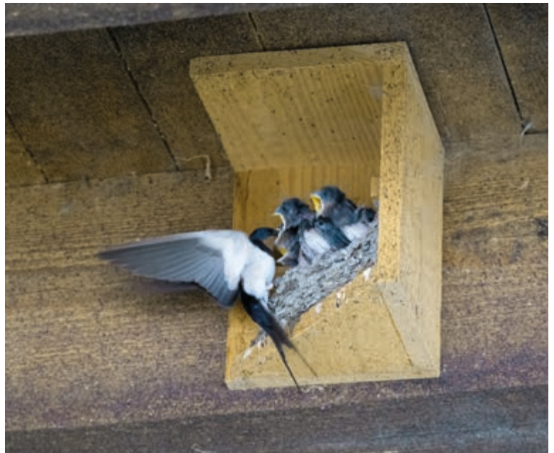
Dreieckige Bodenplatten erleichtern den Anflug ans Nest.