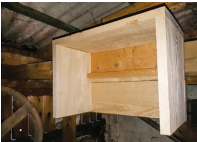
Steht Baumaterial zur Verfügung, kann man Nistplätze auch ohne Kunstnest anbieten.

Rauchschwalben lieben die Privatsphäre und verhalten sich in ihren Nisträumen oft territorial. Vor allem die Erstbesiedler verteidigen nicht nur ihr Nest, sondern auch