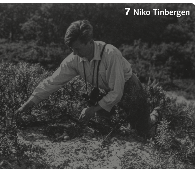
7 Niko Tinbergen