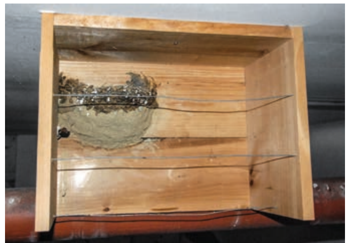
Drähte verhindern den Einflug von Nesträubern.